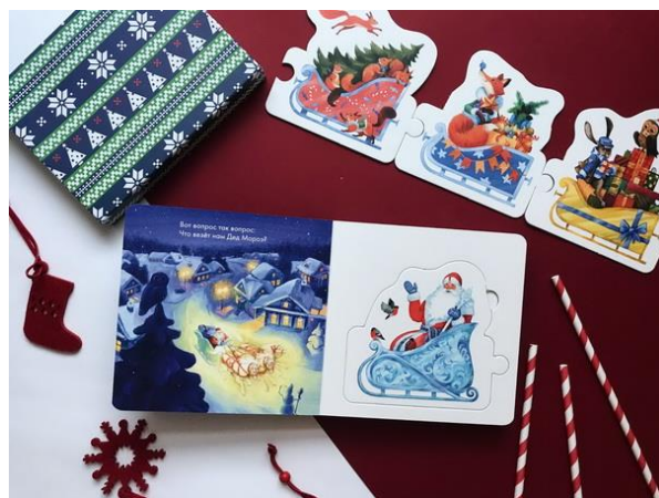
Книжка-пазл «Что везет нам Дед Мороз» поможет рассказать малышу про Новый год.

Откажитесь от сложных блюд или приготовлений. Если вы весь день будете заняты посторонними делами, малыш будет нервничать и капризничать. А это вам совсем ни к чему.